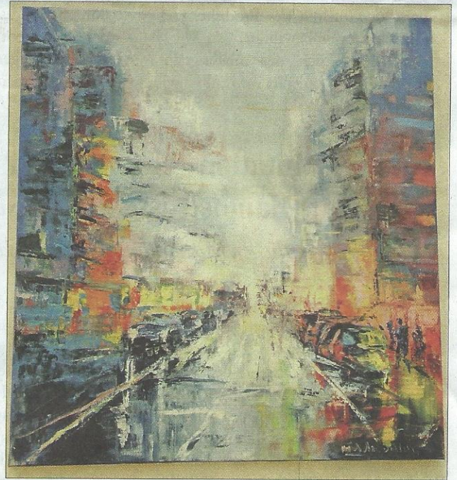
Schnebelen Marie, Öl auf Leinwand