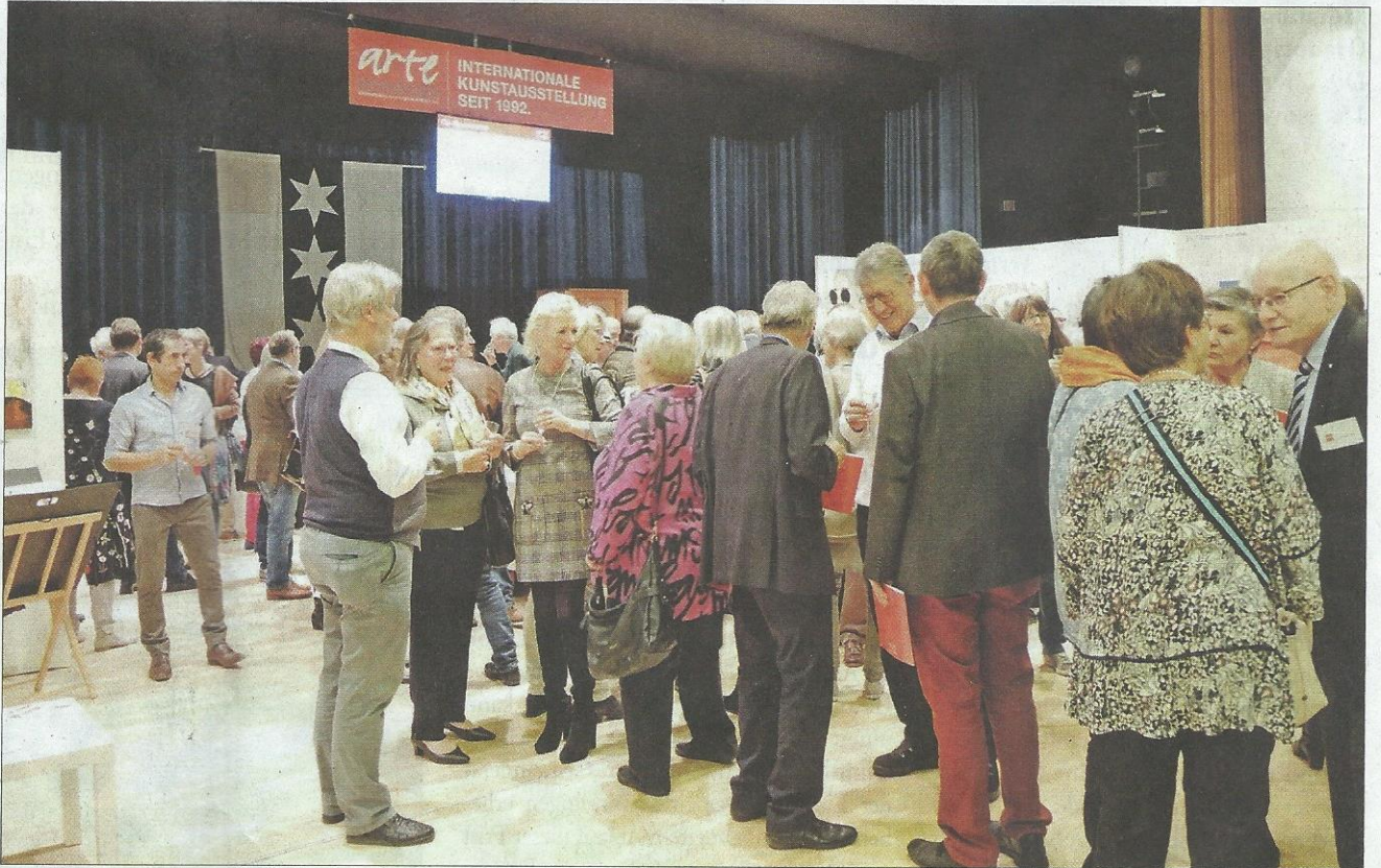
Apéro zur Eröffnung